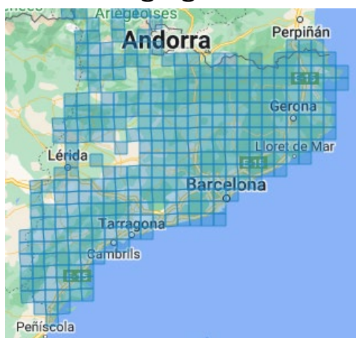
Distribució altitudinal [1-1775]