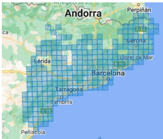
Distribució altitudinal [2-1090]